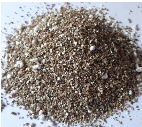
FIGURA 1: Vermiculita (derecha) y caolín blanco (izquierda).